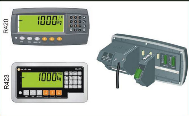
IHG-PFW R42 PRO

IHG german high quality - Deutsche Markenqualität