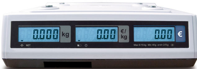
CAS ER PLUS WARENSCHALE / XL-PLATTFORM