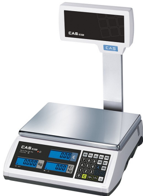
PREISRECHNENDE LADENWAAGE CAS ER PLUS P